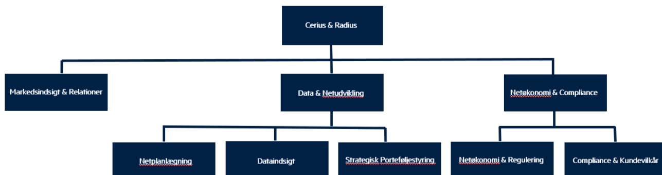
Fig.: Cerius & Radius organisationsplan april 2026